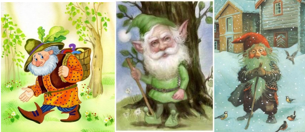
Эти гномик унесли Сашины игрушки

Утром Саша проснулся раньше всех и начал искать на полу игрушки, которые он вечером не убрал на место. Игрушек на полу не было. Значит, их унесли гномики, - подумал Саша. Унесли потому, что Саша не собрал свои игрушки с пола.